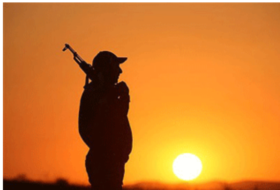
Texte und Fotos: Leon de revagnard

Respektpersonen von heute: Korrupte Politiker, gedopte Spitzensportler, Topmanager die Millionen kassieren, während sie Arbeitsplätze abbauen.